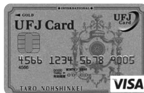
(2) UFJ ニコスクレジットカード

受付には (1) 会員証のみ持参してください。(2) UFJ ニコスクレジットカードの持参は不要です。